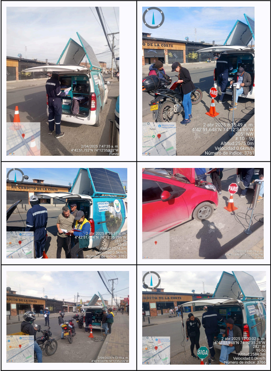
Ilustración No. 1. Operativo pedagógico fuentes móviles.